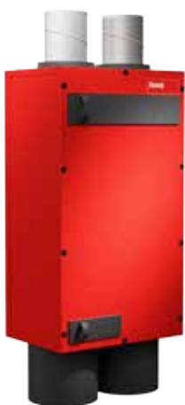
HomeVent® comfort FR (301)