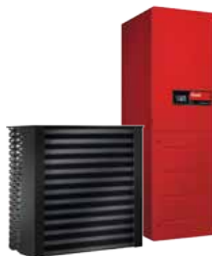
pl.: UltraSource® B hőszivattyú