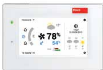
Érintőképernyős TopTronic® E beltéri egység