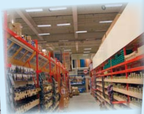
Építési szakáruháza hűtése Hoval csarnokklíma készülékekkel:

Csarnok mérete: ..... 11 000 m 2 , 12 m magas Hűtőtelteljesítmény: ..... 400 kW Frisslevegő-térfogatáram: ..... 50 000 m 3 /h