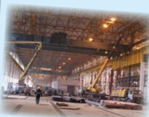
Csővezetékek gyártócsarnokának hűtése Hoval csarnokklíma készülékekkel:

Csarnok mérete: ..... 87 000 m 2 , 24 m magas Hűtőtelteljesítmény: ..... 3 060 kW Frisslevegő-térfogatáram: ..... 408 000 m 3 /h